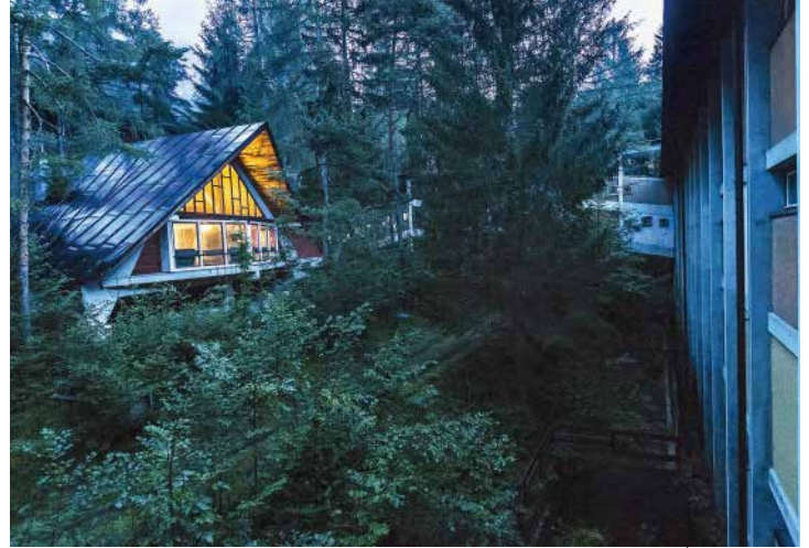
Il campeggio a tende fisse (a sinistra) e una delle strutture della colonia riattivata da Dolomiti Contemporanee e trasformata in un laboratorio per gli artisti. The campsite with fixed tents (left) and one of the structures of the village reopened by Dolomiti Contemporanee and turned into a workshop for artists.

dovuta forse anche ai risvolti della crisi energetica del 1973, i dipendenti finirono per pagare la propria vacanza, sia pure con tariffe agevolate, e le porte furono aperte anche ai turisti.