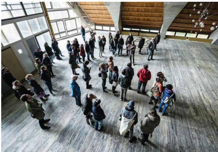
In alto, una delle ville realizzate da Gellner. Sopra, la colonia aperta al pubblico nel corso di un open studio nell'ambito di Progetto Borca. A destra, un artista in residenza. Top, one of the villas built by Gellner. Above, the public visiting the village on an open studio day as part of Progetto Borca. Right, artists in residence.

All the expenses of the employees' holiday with their families were met by ENI, as was much of the cost of the journey to the village. The dream of a community in which interaction was unaffected by social class and the children of managers made friends with those of workers was being realized. The site that the designer had found and presented to his client was not a luxuriant location, but an area of degraded woodland. At a time when no one was even thinking about preserving the landscape, Gellner did not intend to fell a single tree to make room for the constructions and Mattei was thinking along the same lines. Thus the abandoned site gave them the possibility of constructing the architecture and the landscape at the same time. And within a few years, in fact, the village would be completely immersed in a new and thick forest. The lengthy work on the project came to an end only after Mattei's tragic death, in the autumn of 1962. With the acquisition of the village by Snamprogetti, a subsidiary of the ENI group, the "social miracle" suffered a setback, perhaps due in part to the consequences of the energy crisis of 1973, and the employees ended up paying for their holidays, although at special rates, and the doors were opened to tourists as well. The second phase in the life of the resort, which came with the transfer of ownership to Mi.no.ter, is linked